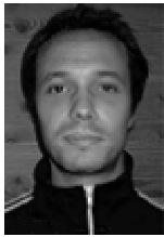
Af Rasmus Leander Nielsen

21. marts 2005 | I februar erklærede Nordkorea, at landet er i besiddelse af atomvåben og at man ikke ville deltage i en ny runde af de igangværende sekspartsforhandlinger mellem de to Koreae, Japan, USA, Rusland og Kina. Således har Nordkorea endnu engang eskaleret retorikken, hvilket har fået medier og kommentatorer til igen at udpege Pyongyang-regimet som uberegneligt og utilregneligt: som et irrationelt levn fra dengang verden var fastlåst i den bipolære nervekrig under Den Kolde Krig. Men det modsatte er tilfældet: Nordkorea er hverken irrationel eller uberegnelig.